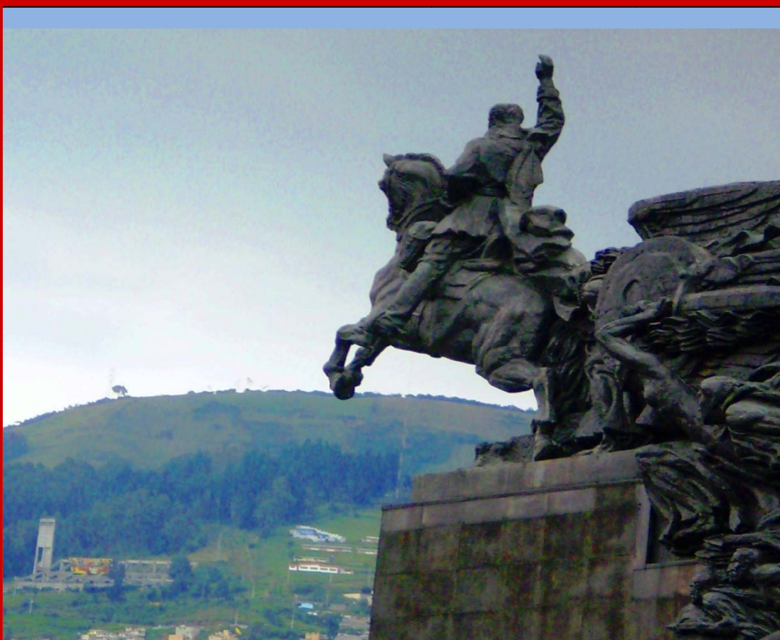
Estatua Ecuestre de Simón Bolívar, La Alameda (al fondo, la Cima de la Libertad)