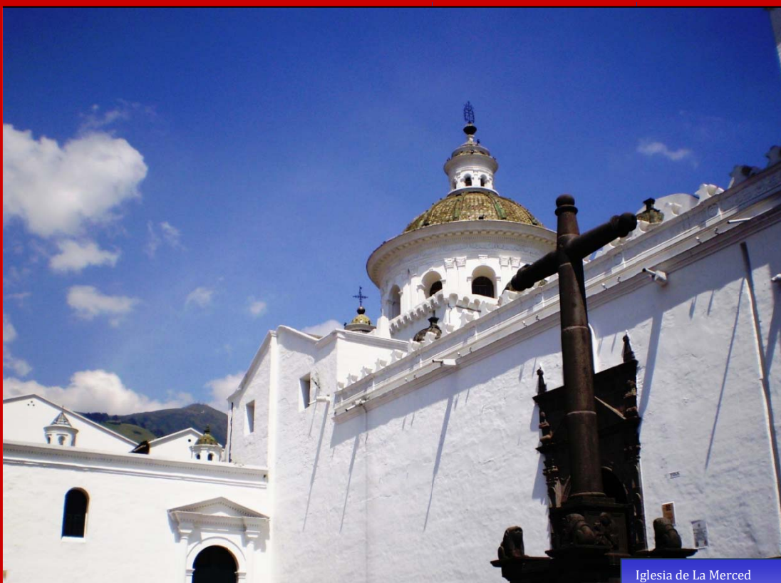
Iglesia de La Merced

B o l e t í n de o c u p a c i ó n h o t e l e r a