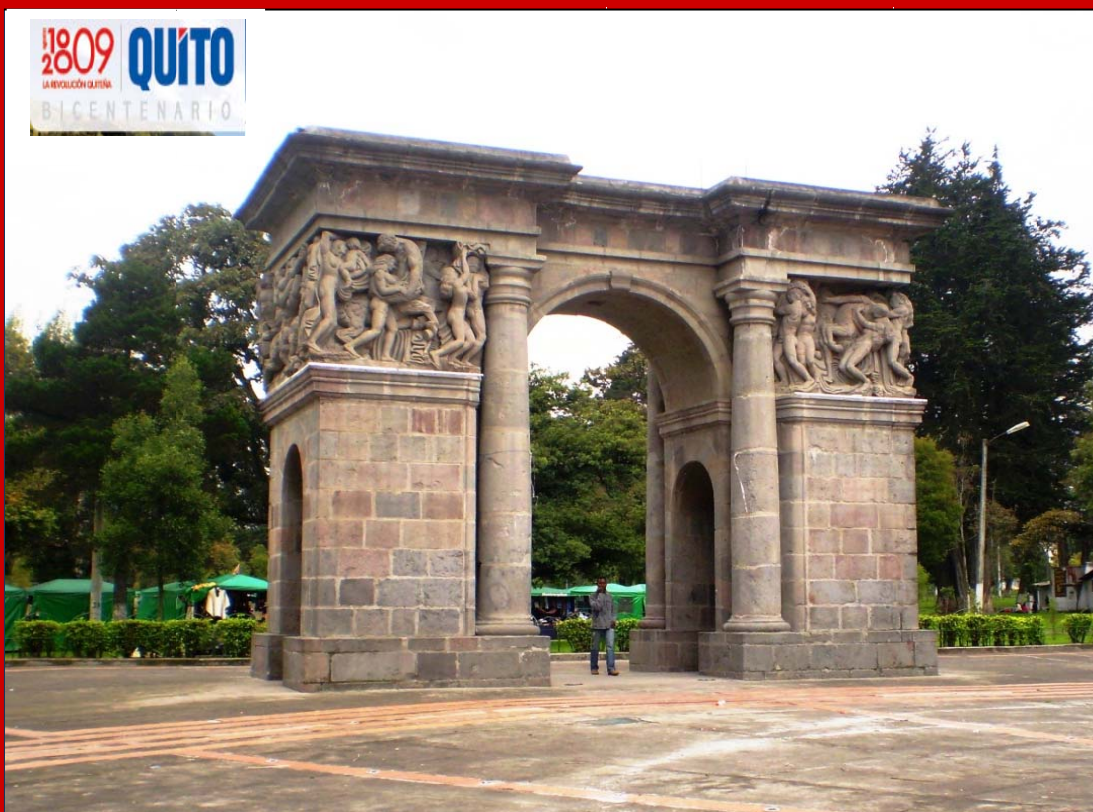
Puerta de la Circasiana, Parque El Ejido, Av. Amazonas y Patria

B o i e t í n de o c u p a c i ó n h o t e l e r a